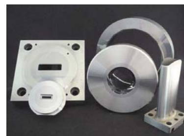
電池缶絞り用金型