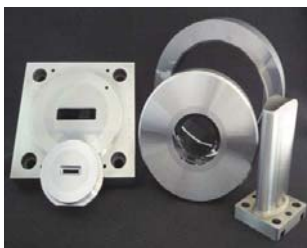
電池缶絞り用金型